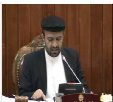
زیادی با کمبود نصاب رو به رو می شود

اعضای مجلسین شورای ملی بارها از حکومت چنین خواستی داشته اند اما تا کنون جواب مناسبی از سوی حکومت در این مورد دریافت نکرده اند.