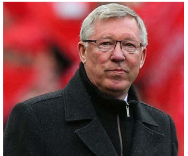
سرمربی پیشین منچستریونایتد اعلام کرد باشگاه یوونتوس باید در تابستان جاری هافبک فرانسوی‌اش را به فروش برساند.

پیرمرد اسکاتلندی در این مورد هم گفت: یووه تیم خوبی است. آنها چهار بار پیاپی است که در لیگ فوتبال ایتالیا عنوان قهرمانی را کسب می‌کنند و در فینال اروپا نیز کمی بدشانس بودند. آنها مغلوب ضدحمله‌های بارسلونا شدند اما بیش از آنها توپ را در اختیار داشتند.