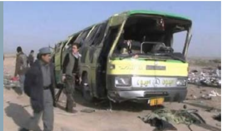
در نتیجه واژگون شدن یک موتر مسافربری نوع ۳۰۳ در ولایت غزنی ۲۹ تن، به شمول ۲ کودک و یک زن، زخمی شدند.

شاهراه کابل - قندهار از مسیرهایی با حوادث زیاد ترافیکی است. بر بنیاد گزارش‌ها، سالانه صدها تن در رویدادهای ترافیکی در کشور جان می‌بازند. مسوولان، عامل بیشتر این رویدادها را خرابی جاده‌ها، نبود علائم ترافیکی و عدم رعایت قوانین ترافیکی از سوی راننده‌ها می‌دانند.