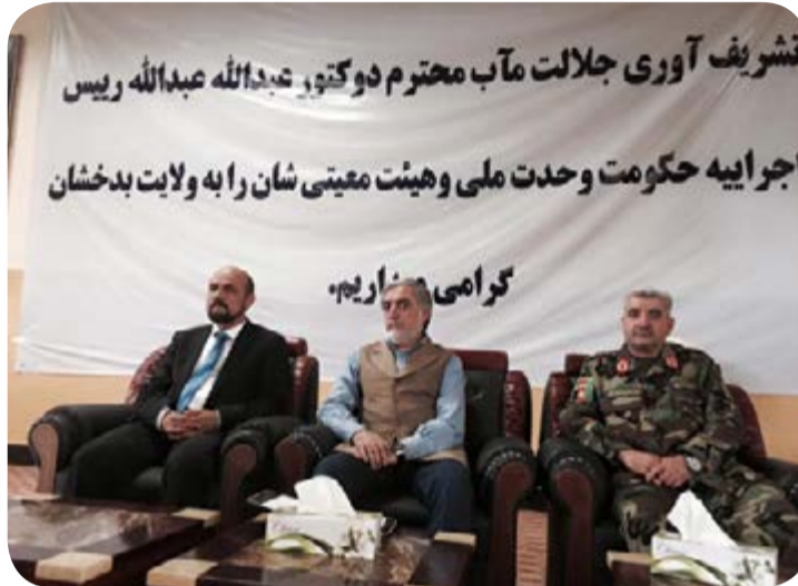
افغانستان عنوان کردند.

اگر اشرف غنی می‌خواهد این پیام را به کرزی ارسال کند که از حوزه وظایفش عقب نشینی کند، احتمال پیروی کردن کرزی از وی بسیار اندک است. بسیاری از تحلیل‌گران و مشاوران تاکید دارند که وی جایگاه خود را به نحوی تحکیم کرده است که تنها جایگزین با ثبات برای دولتی محسوب می‌شود که تاکنون نتوانسته است خوب عمل کند.