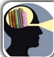
روشن فکری دینی و چالش های فراراه