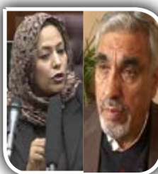
«حکومت دوسره» به تشدید بحران نپردازد