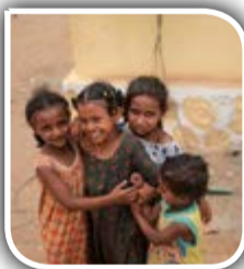
نگاهی به خدمات اجتماعی در اسلام