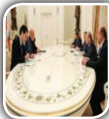
فسیل های سیاسی در مسکو