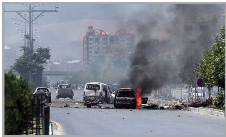
برخی از آگاهان امور بر این عقیده اند که وقوع چنین رویدادهایی ضعف

این در حالی است طالبان طی روزهای اخیر ولسوالی دشت ارچی در ولایت قندوز را تصرف کرده و صدها تن از آنها نیز در جریان درگیری با نیروهای دولتی موفق شدند خود را به روستای چهاردره،