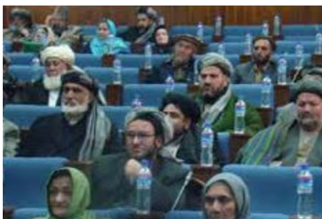
طالبان مهلت خواسته است.

منشی مجلس سنا: مقام های محلی به ویژه والی قندوز بی کفایت است. اگر تغییرات در رهبری ولایت قندوز صورت نگیرد، این ولایت سقوط خواهد کرد. به گفته وی، زمینه سقوط را خود دولت فراهم کرده است