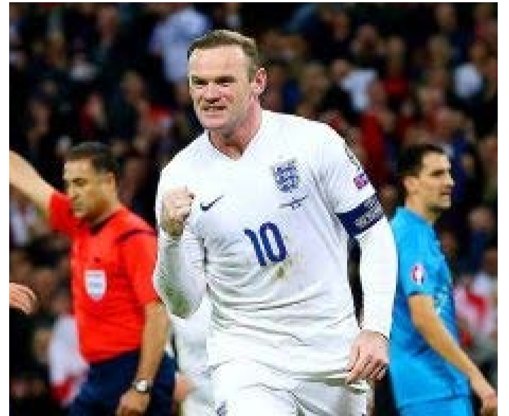
تیمهای انگلیس و اسپانیا موفق شدند با نتایج نزدیک حریفانشان را در انتخابی یورو ۲۰۱۶ شکست دهند.

رقابت های انتخابی یورو ۲۰۱۶ در قاره اروپا با برگزاری چند دیدار ادامه یافت که در مهمترین بازی ها انگلیس و اسپانیا حریفانشان را شکست دادند. در گروه C اسپانیا موفق شد با تک گل داوید سیلوا هافبک منچستر سیتی بلاروس را شکست دهد. اسلواکی در خانه با نتیجه ۲ بر یک مقدونیه را شکست داد و اوکراین با ۳ گل لوکزامبورگ را از پیش روی برداشت. انگلیس که تاکنون تمام دیدارهای خودش را در انتخابی یورو ۲۰۱۶ برده است در خانه اسلوانی توانست با نتیجه ۳ بر ۲ صاحب برتری شود. در این دیدار جک ویلشر توانست دو گل زیبا را به ثمر برساند ولی اسلوانی میزبان که نمی خواست بازنده باشد، بازی را به تساوی کشاند تا اینکه وین رونی توانست چهل و هشتمین گل خود را با پیراهن انگلیس به ثمر برساند و به رکورد گری لینه کر برسد. به این ترتیب این دیدار با برتری ۳ بر ۲ انگلیس به پایان رسید. در این گروه دیدار لیتوانی و سوئیس با برتری ۲ بر یک سوئیس به پایان رسید و استونی با ۲ گل سان مارینو را شکست داد. در گروه G روسیه میزبان جام جهانی در خانه با یک گل برابر اتریش شکست خورد. دیدار مولداوی و لیختن اشتاین با تساوی یک بر یک خاتمه یافت و سوئد با نتیجه ۳ بر یک مونته نگرو را شکست داد. در این بازی مارکوس برگ و زلاتان ابراهیموویچ دو بار برای سوئد گلزنی کردند.