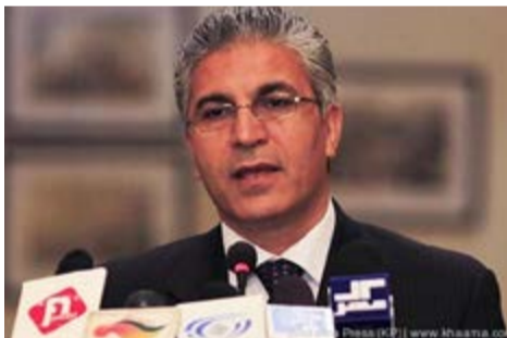
نقطه پایان بگذارد. این اظهارات در حالی مطرح ... ادامه صفحه ۶

افغانستان می تواند با استخراج معیاری منابع طبیعی اش به فقر دائمی نقطه پایان بگذارد