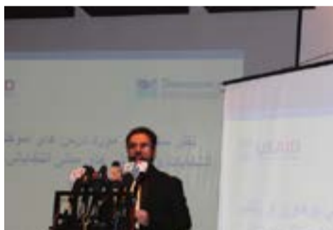
درصد از مصاحبه شونده‌گان به این باوراند که افغانستان به سمت درست به پیش می‌رود که این رقم از نظرسنجی که... ادامه صفحه ۶