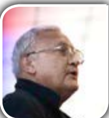
رهنورد نامۀ قلندر زریاب

وظیفه‌رئیس تربیت بدنی به حالت تعلیق در آمد