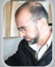
عبد الحفیظ منصور

عبدالله عزام که نویسنده، سخنران و مبارز پرشوری بود، در سال ۱۳۶۸ هـ خ در اثر انفجار ماین، همراه با پسرش در پشاور کشته شد. در زمان حیات او، اسامه بن لادن و دکتر ایمن الظواهری، اشخاص ناشناخته‌یی بودند. اولی بیشتر در پایگاه جاجی ولایت پکتیا با مجاهدین زنده‌گی می‌کرد و به خاطر ثروت هنگفتش مورد توجه بود، و دومی در یکی از کلینیک‌ها به کار طبابت مشغول بود. اسامه عربستانی‌الاصل و از یک خانواده میلیونر بود، و ظواهری از کشور مصر است و در گذشته، رهبر یکی از شاخه‌های اسلامی در آن کشور بوده است. پس از شهادت عزام، اسامه بن لادن و پس از کشته شدن اسامه، ایمن الظواهری به رهبری القاعده رسید.