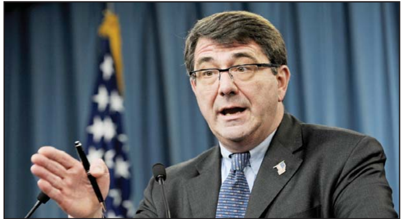
امریکا اگر واقعا قصد تقویت نیروهای نظامی افغانستان را داشته باشد، می تواند این کار را در مدت چند سال و با پذیرش افسران بومی در مراکز آموزشی امریکا انجام دهد.

خود برای کسب ریاست جمهوری در سال ۲۰۰۸ میلادی خروج فوری نیروهای کشورش را از افغانستان و عراق به عنوان یکی از محوری ترین برنامه هایش مطرح کند، تا جایی که افکار عمومی امریکا، وی را به عنوان نامزد مخالف جنگ شناخت. البته آنچه در عمل رخ داد، تمدید حضور نیروهای بین المللی در افغانستان بود تا