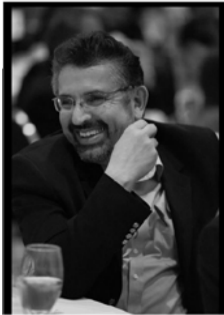
پژوهش‌هایی در عرصه علوم سیاسی باشد.