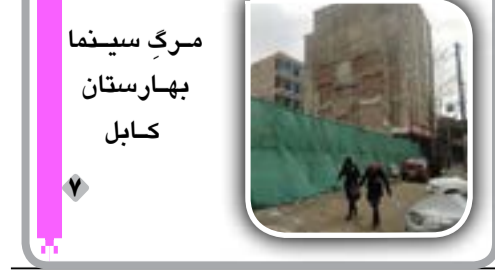
مرگ سینما بهارستان کابل