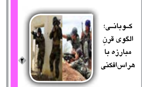
کوبانی: الگوی قرن مبارزه با هراس افکنی