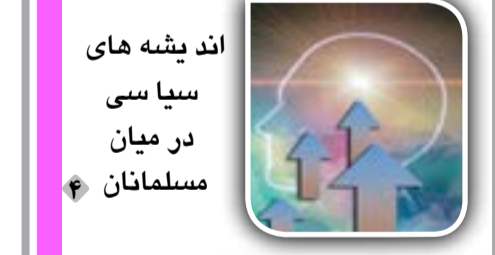
اندیشه‌های سیاسی در میان مسلمانان