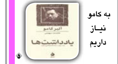
به کامو نیاز داریم