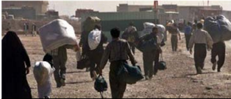
مردم افغانستان در گذشته نه‌چندان دور، طعم تلخ و مرگبار حاکمیت طالب را چشیده‌اند و اکنون گروه داعش برای آن‌ها تداعی‌کننده نسخه آتشین‌تر و سوزنده‌تر طالبانسم و تحجر است. خشونت‌ها که دو دهه قبل در قالب «امیرالمومنین» از «قندهار» آغاز شد و خرمن آرزوهای مردم را بریاد داد، امروز از «موصل» در قالب «خلیفه» به‌راه افتاده و گویا می‌خواهد منطقه و جهان را بسوزاند.

این شبکه یکی از سه گروه اصلی شورشی در افغانستان است که رهبری آن به دوش سراج الدین