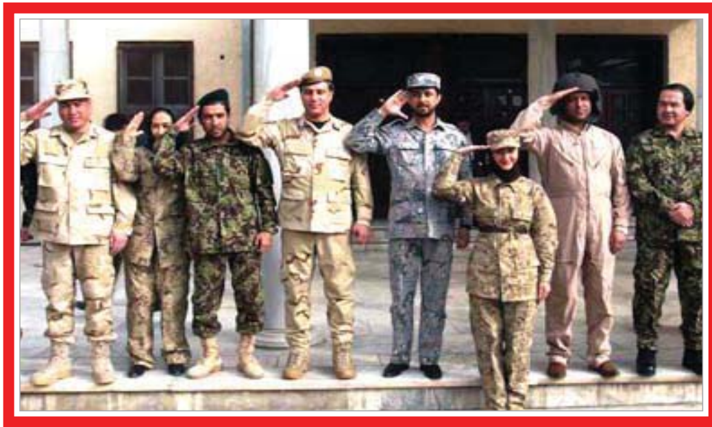
کمک به نیروهای امنیتی و تامین امنیت، بیشتر از پوشیدن لباس رزم نمادین به اتخاذ عزم بنیادین و ملی نیاز دارد.

با این حال، ناظران ضمن ستایش از این ابتکارات، تاکید می کنند که نیروهای امنیتی نیاز به اقداماتی دارند که بتواند نیازمندی های آنها را تامین کند، مشکلات