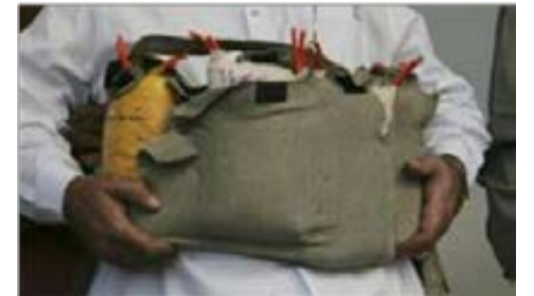
در پی یک عملیات نیروهای امنیتی در شهر غزنی سه انتحارکننده بازداشت و یکی دیگر آنان کشته شد. شفیق ننگ

از سوی هم، یک منبع که نخواسته نامی از او گرفته شود گفته که این افراد لباس واکنش سریع را به تن داشتند و می‌خواستند تا در منطقه سفندی شهر غزنی قطعه واکنش سریع را آماج قرار دهند.