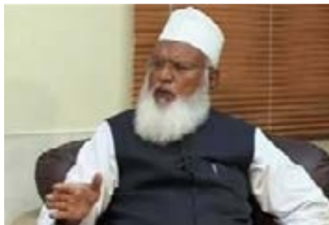
طالبان از اهمیت زیادی برخوردار است.

در شرایط فعلی سخنان مفتی اعظم پاکستان علیه