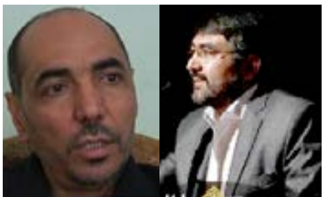
برگزاری انتخابات پارلمانی خواهد بود.

این درحالی است که افغانستان تاچند ماه دیگر شاهد