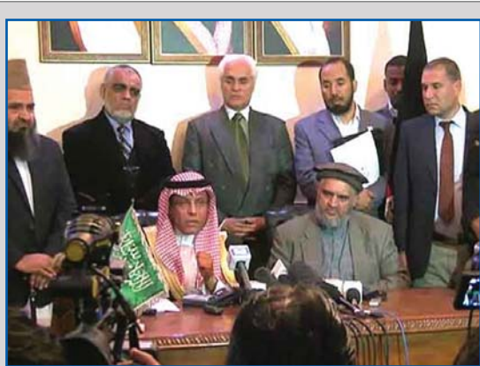
متاسفانه وهابیت امروزه با در دست داشتن سرزمین نفت خیز و ثروتمند عربستان و تکیه بر ثروت عظیم خدادادی توانسته است به جریان نیرومندی تبدیل شود و سازمان های بی شماری را در جهان برای تبلیغ مرام خویش بنیان نهد که از آن جمله می توان به سپاه صحابه و جمعیت العلمای پاکستان، القاعده و داعش اشاره کرد.

وی تاکید کرد: مطابق قانون، باید ۵ درصد درآمدهای معدن برای رشد زندگی مردم محل به مصرف برسد. ولسوالی ناهورغزنی، حدوداً ۱۰۰ کیلومتر از مرکز این ولایت فاصله دارد و در سمت غرب غزنی واقع شده است. معدن لیتیم در دشت ناهور بار نخست توسط سروی گران پی آر تی غزنی کشف شد.