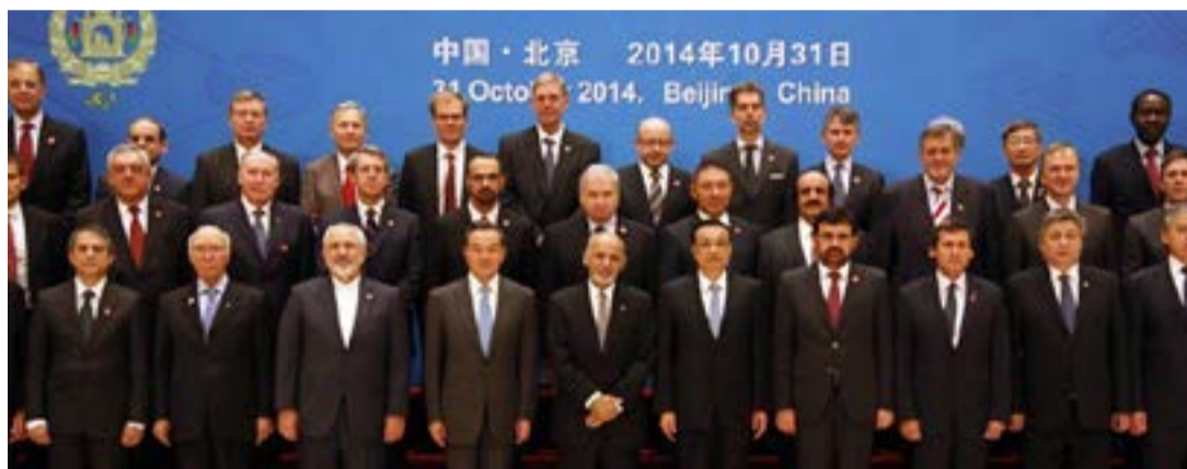
کریستین ساینس مانیاتور

به امضا رسید اما این شرکت دولتی پس از اینکه مورد حمله نیروهای طالبان قرار گرفت، فعالیت‌های خود را در افغانستان متوقف کرد.