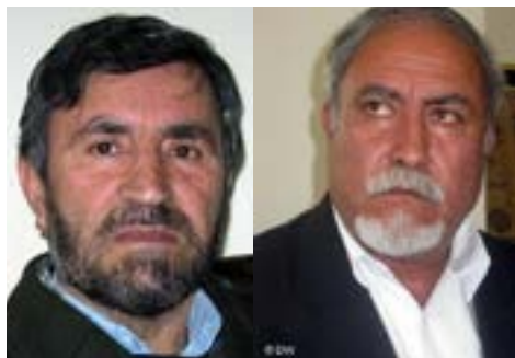
امیدواری می‌کنند که در کنفرانس لندن تعهدات مالی تجدید شده و... ادامه صفحه ۶

افغانستان به عنوان کشور عقب‌مانده و مصرفی و نبود برنامه‌های مشخص در خصوص جذب وعده‌های داده شده جهانی، سبب شده تا افغانستان نتواند از چنین نشست‌ها حد اقل استفاده را ببرد. قرار است کنفرانس لندن در ۲۴ نوامبر ۲۰۱۴ در شهر لندن برگزار شود و در مورد وضعیت اقتصادی افغانستان در آن‌جا بحث و تبادل نظر صورت گیرد. افغانستان امیدوار است که در کنفرانس لندن تعهدات مالی تجدید شود و حمایت‌های بیشتر اقتصادی برای حکومت داری و ادامه بازسازی این کشور به دست آید. مسولان اتاق تجارت و صنایع افغانستان ابراز