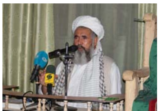
استفاده کند. آقای غوردروازی افزود:

توطئه هنوز ادامه دارد. وی ادامه داد: زمانی که داعش اعلام خلافت اسلامی می کند و در آن زمان کردستان عراق اعلام می کند که دولت خودشان را تشکیل می دهند. وی ادامه می دهد، هدفی که اسرائیل در پی آن است این است که ملت ها را تجزیه کند و از این فرصت برای پیشبرد اهداف خودش