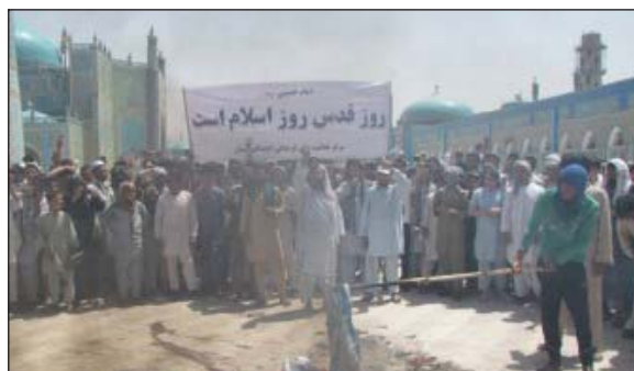
در پشت این آتش افروزی‌ها دست‌های مهم و خطرناک و اهداف شیطانی دیگری پنهان است که متأسفانه اختلاف‌های فرقه‌ای و حامیان اسرائیل و دولت‌های عربی در این توطئه‌ها نقش خطرناکی را ایفا می‌کنند.