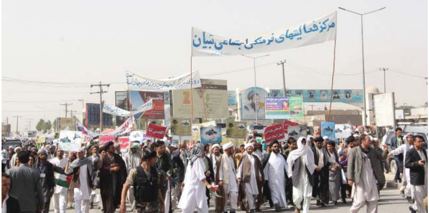
امروز روزی است که اوج جنایت رژیم اشغالگر قدس آشکار شده است و مردم مسلمان هم از روزهای قبل تا به حال در صحنه‌های گوناگون حضور به هم رساندند و در رابطه با وقایع موجود در سرزمین فلسطین ابراز نظر و علیه اسرئیل ابراز انزجار کردند و عملیات‌های ددمنشانه و وحشیانه آنان را محکوم و از مردم فلسطین اعلام حمایت نمودند

عضو جبهه ملی مخالفت با پایگاه‌های خارجی‌ها در افغانستان: